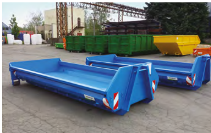
CITY-WDC z klapą krzyżową