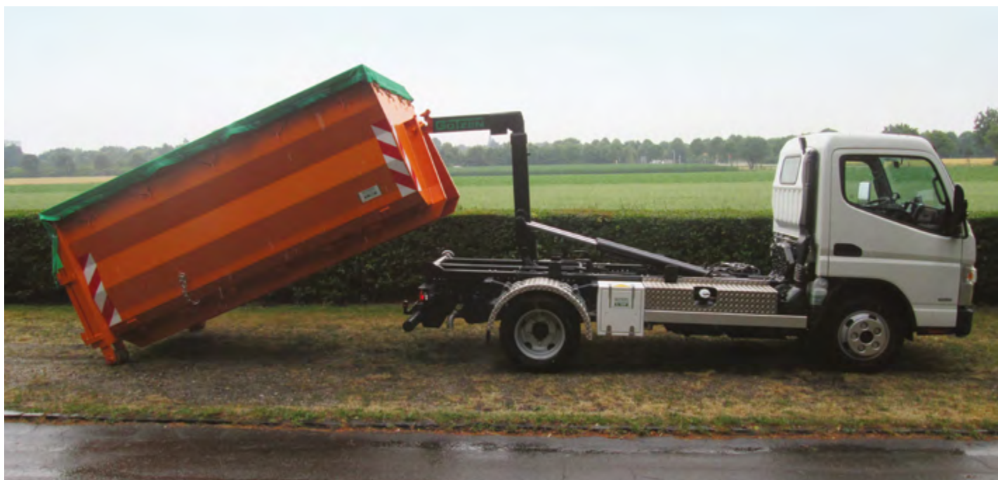
Kontenery wielkopojemnościowe CITY-WDC