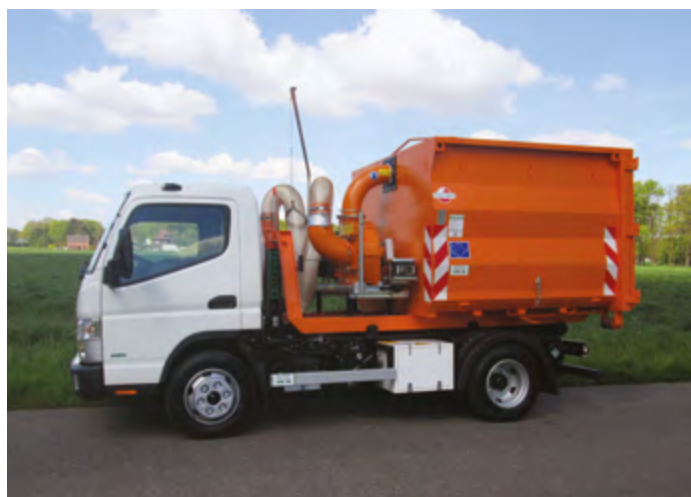
CITY-WDC z wykończeniem do zasysania liści