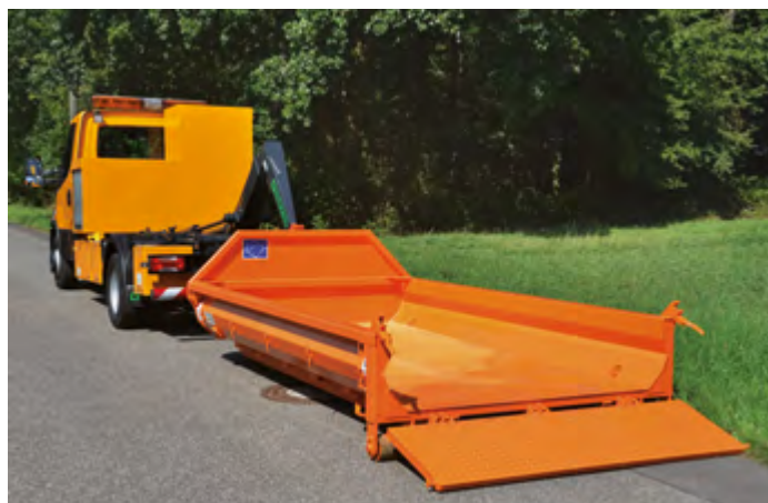
CITY-WDC z klapą krzyżową