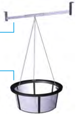
Filtr koszowy z drobnym sitem do zawieszenia do włazu