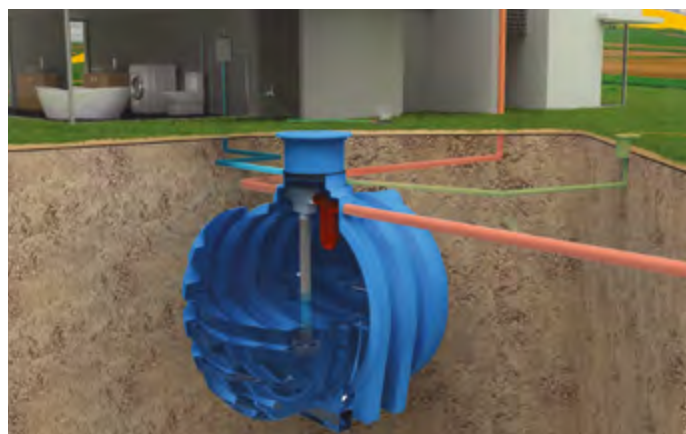
NEPTUN zainstalowany z zestawem wlewowym