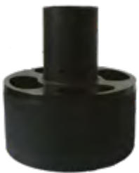
Uspokojony wlew zapobiegający zawirowaniom osadów w zbiorniku