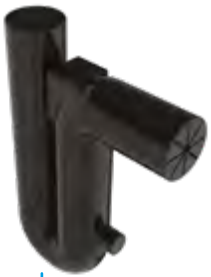
Syfon przelewowy z zabezpieczeniem przed gryzoniami